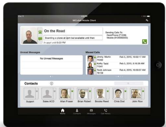
MiCollab Client auf einem iPad®

Aufwertung der Kommunikation und Produktivität durch die Integration in andere Business-Anwendungen, z. B. Outlook®, Lotus Notes®, IBM® Sametime und Google®.